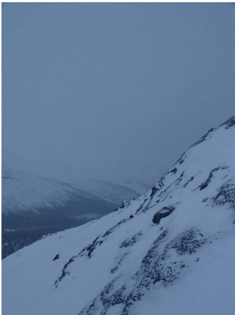
Подъём на 1116

8.10. Встал, кипячу воду для завтрака. Спалось нормально – гораздо лучше, чем в предыдущую ночь – приновился нормально затягивать спальник. Ночь заметно холоднее предыдущей. Ботинки смёрзлись и превратились в льдинки ботинкообразной формы ( к сожалению мои габариты не позволяют хранить их в спальнике ). Разложил их вокруг горелки, хотя эффекта пока нет. Седня ночью опять засыпало, хотя и не так сильно, как предыдущей. Садятся батарейки у фонаря, значит максимальное я тут переночую ещё один раз с комфортом – остался только один комплект. Чай в термосе окончательно замёрз (его я брал ещё из дому). Кое-как разморозил ботинки. Собираюсь в путь.