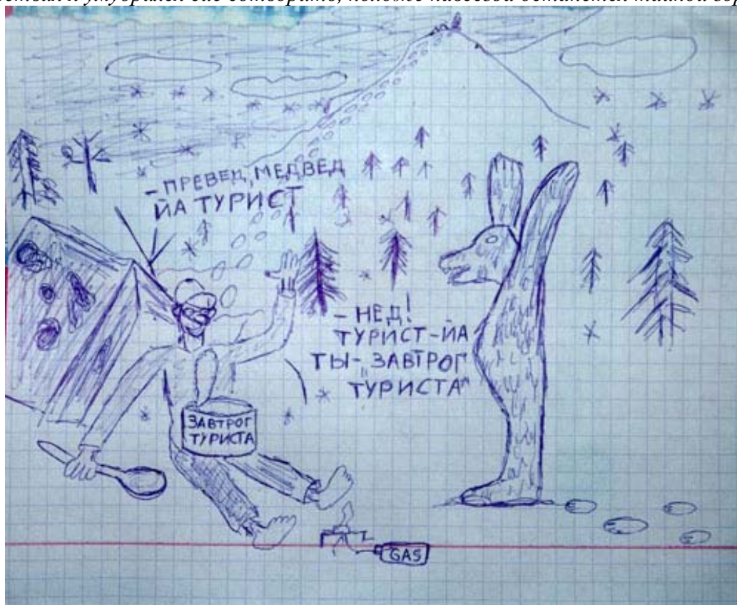
А это так.... В продолжение темы ;)

P.S. Прибыв в 5 утра домой – попил чаю и попёрся в травмпункт – оказалось палец на ноге сломал (вот ведь что значит электрическое освещение!!!!!! В темноте хибинской и не заметил бы, его распухшие округлости и синеватый цвет.) Когда за время путешествия я умудрился сие сотворить, похоже навсегда останется тайной гор ©.