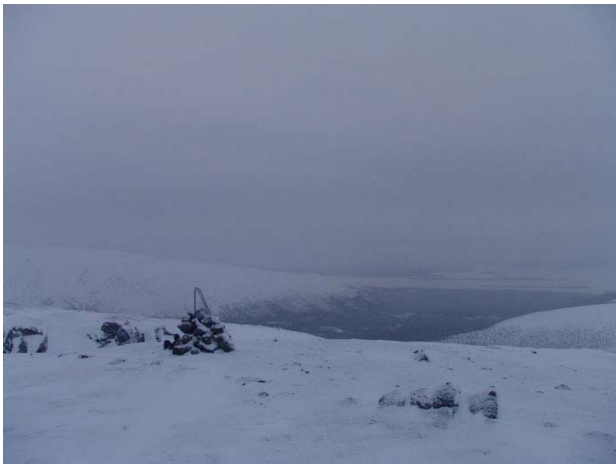
Вершина 956 м.

Облака развеялись над Имандрой, а теперь настырно лезут ко мне.