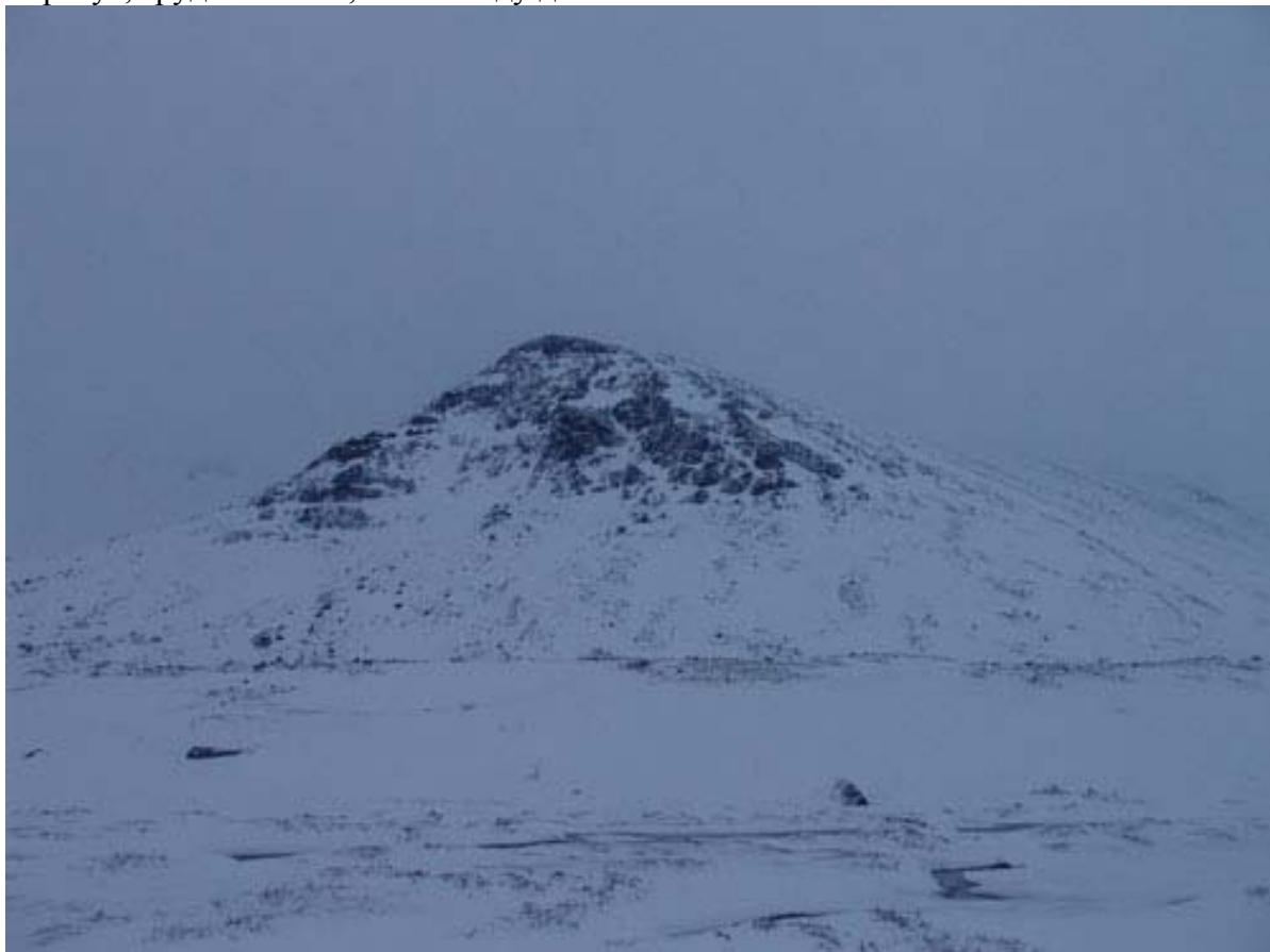
В верховьях Малой Белой.